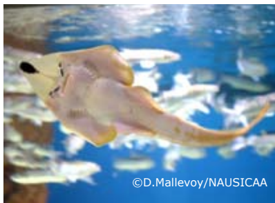
La raie guitare espace 5