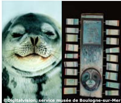
Le phoque, symbolique et représentation plastique en Alaska

Billet couplé Nausicaá - Musée de Boulogne-sur-Mer : « Une journée en Alaska » avec fiches d'accompagnement pour élève et enseignant, communes aux deux structures. Un tarif plus avantageux. Vous pouvez dissocier les jours de visite de ces deux structures.