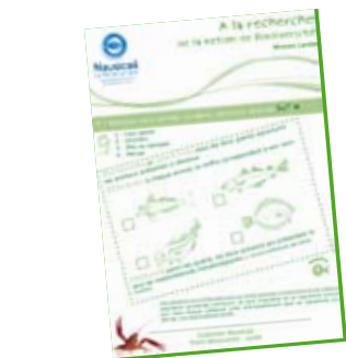
Fiche élève sur la biodiversité niveau Lycée

Vous désirez découvrir Nausicaá autrement ? Nous vous invitons à suivre des jeux de pistes thématiques imaginés par l'équipe éducative au cœur de notre Exposition. Vous pouvez télécharger l'application avant votre visite et commencer à jouer dès votre arrivée. Le principe ? Trouvez des illustrations grâce à nos indices puis scannez-les grâce à votre smartphone afin d'accéder à de nombreuses activités ludiques : répondez à des quiz, dessinez des animaux, gardez des souvenirs en prenant des photos, des vidéos ou en rédigeant votre propre commentaire ! De retour chez vous, vous pouvez imprimer l'intégralité de votre jeu de piste. L'application est disponible gratuitement sur Google Play pour Android et sur l'Apple Store pour Iphone. Elle est également accessible sur http://www.nausicaa.fr/jeux-de-piste.html