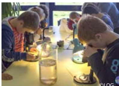
Ateliers d'observation du LOG