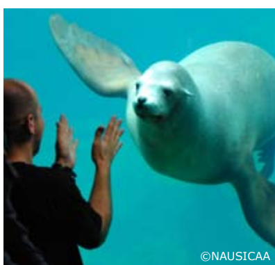
Les otaires de Nausicaá